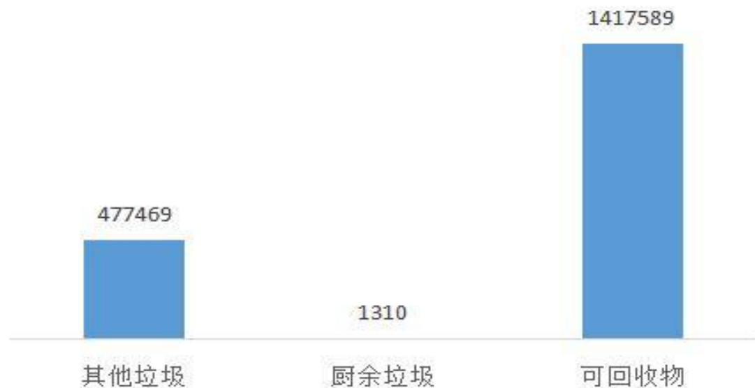
垃圾分类种类积分